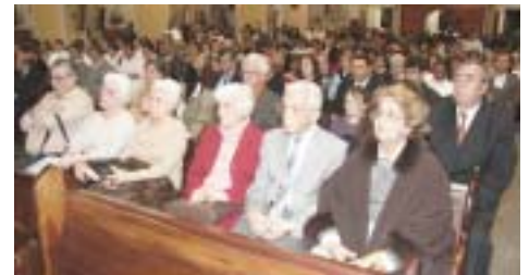
Irmãs e familiares de Dom Luiz