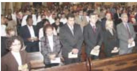
Convidados e autoridades na celebração